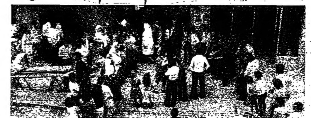
مجموعة من المواطنين امام احد الافران للحصول على الخبز

وتصرنا هذا كان من منطلق السماع المجال امام الحكومة والماسي الجبلية اليوم على سيد المن.